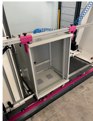
Fissaggio armadio completo

Il costo totale è dato dall'eventuale rielaborazione del disegno, sommato al tempo della lavorazione in sé.