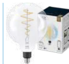
WIZ TW Globo G200 Filamento 60W E27