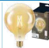
WiZ TW Globo G125 Filamento Ambrata 50W E27