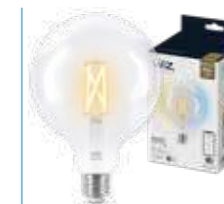
WIZ TW Globo G120 Filamento 60W E27