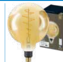
WiZ TW Globo G200 Filamento Ambrata 25W E27