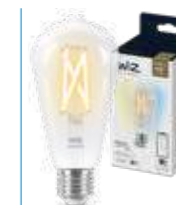
WIZ TW Edison Filamento 60W E27