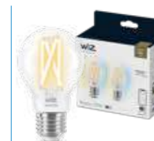
WIZ TW Bipack Goccia Filamento 60W E27