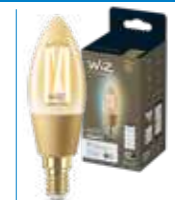
WiZ TW Candela Filamento Ambrata 25W E14