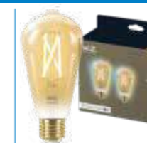
WiZ TW Bipack Edison Filamento Ambrata 50W E27