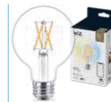
WIZ TW Globo G95 Filamento 60W E27