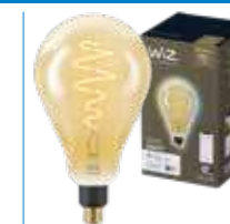
WiZ TW Globo Giant Filamento Ambrata 25W E27