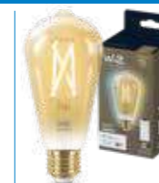
WiZ TW Edison Filamento Ambrata 50W E27