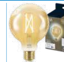
WiZ TW Globo G95 Filamento Ambrata 50W E27