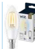
WIZ TW Candela Filamento 40W